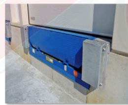
Topes de protección