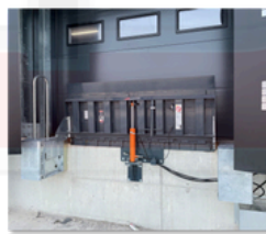
Pasarelas de carga