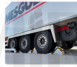
Calzos de seguridad