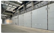
Puertas para plantas compostaje