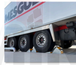
Calzos de seguridad