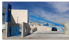
Puertas apertura Vertical