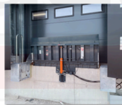
Pasarelas de carga