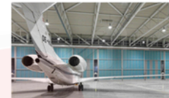
Puertas para Hangares